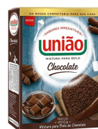
409124 MISTURA PARA BOLO CHOCOLATE UNIÃO 400G CX/12 7891910030200