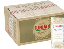
409203 AÇÚCAR PREMIUM SACHET UNIÃO 1000X5G CX/01 17891910020154