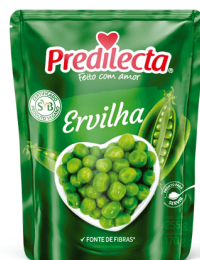
4143 ERVILHA EM CONSERVA PREDILECTA 1,7KG CX/12 7896292311435