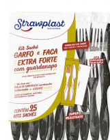
7241 KIT GARFO/FACA FORTE PRETO GRANEL CX/250 7898202612656