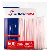
4251 CANUDO FAST FOOD SACHE 6MM 6X500 CX/3000 7898202613301