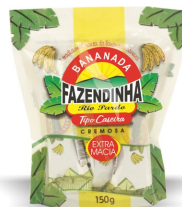
0515 BANANADA STAND UP TRADICIONAL 5X30G UND 7897011000036