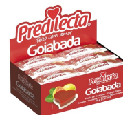
1704 GOIABADA SACHÉ DISPLAY PREDILECTA 30X40G DP/12 7896292317048