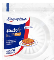
2851 PRATO REDONDO CRISTAL 18CM 14X10 CX/140 7898202610713