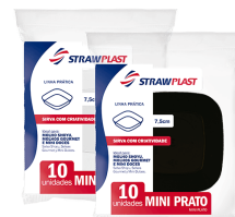
7531 MINI PRATO PRETO 48X10 CX/480 7898202612793