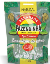
0516 BANANADA STAND UP S/ AÇÚCAR 5X23G UND 7897011000289