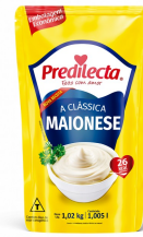
0269 MAIONESE PREDILECTA 1,02KG UN 7896292315327