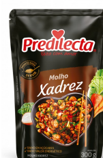
0900 MOLHO XADREZ ST UP PREDILECTA 300G CX/24 7896292309005