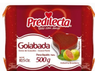
1005 GOIABADA FLOW PACK PREDILECTA 500G CX/36 7896292330207