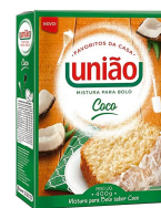
409134 MISTURA PARA BOLO COCO UNIÃO 400G CX/12 7891910030217