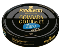
6005 GOIABADA GOURMET ZERO LATA 600ML CX/12 7896292360051