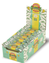
0514 BANANADA NATURAL S/ AÇÚCAR 32X23G DP/32 7897011000258