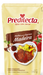
0579 MOLHO MADEIRA PREDILECTA 340G CX/24 7896292305793