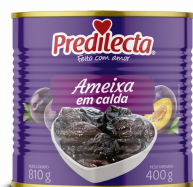
0560 AMEIXA EM CALDA LATA 400G CX/12 7896292305601