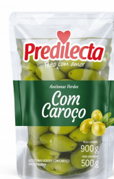
0080 AZEITONAS VERDES ST UP PREDILECTA 500G CX/12 789629230080-4