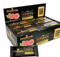
1804 GOIABADA GOURMET ZERO 30G DP/12 7896292318045