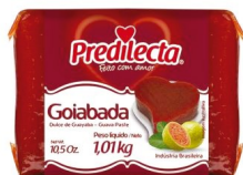
0006 GOIABADA FLOW PACK PREDILECTA 1,01KG CX/16 789622300064