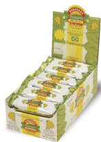
0513 BANANADA TRADICIONAL 24X30G DP/24 7897011000272