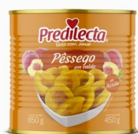
0135 PÊSSEGO EM CALDA LATA 450G CX/12 7896292301351