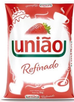
409144 AÇÚCAR REFINADO AMORFO ESPECIAL UNIÃO 5KG FD/05 7891910008353