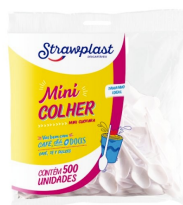
2291 MINI COLHER CRISTAL 6X500 CX/3000 7898202610515