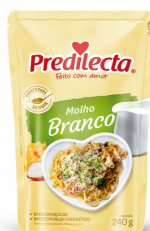
0951 MOLHO BRANCO PREDILECTA 240G CX/24 7896292309517