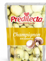
1517 COGUMELO CHAMPIGNON PREDILECTA ST UP 100G CX/24 78962922231514