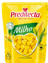
4142 MILHO EM CONSERVA PREDILECTA 1,7KG CX/12 7896292311428