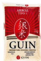
3111 ARROZ BENEFICIADO LONGO T 1 GUIN 5KG FD/06 768421100005