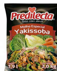
0796 MOLHO YAKISSOBA PREDILECTA 2,0KG CX/08 7896292307544