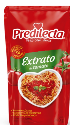
0442 EXTRATO DE TOMATE PREDILECTA 340G CX/24 7896292304420