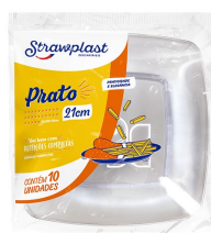
2751 PRATO Q. 21 CM CRISTAL 14X10 CX/140 17898202610512