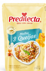
0955 MOLHO 3 QUEIJOS PREDILECTA 240G CX/24 7896292309555