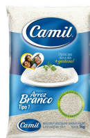
1125 ARROZ BRANCO T1 CAMIL 5KG FD/06 7896006711155